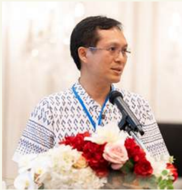
アティパン新AJDA会長