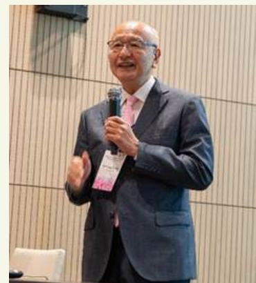
田上順次名誉教授