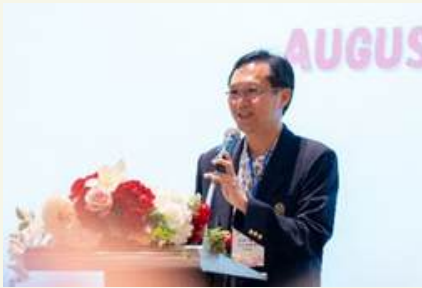
アティバン前JDAT会長