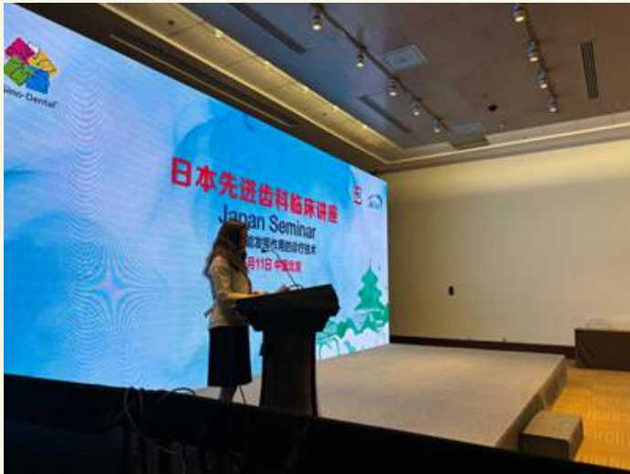
オープニング・スピーチ

コロナ禍後初めて参加企業の交流会が開催され、和気あいあいとした雰囲気のなか、情報交換がされました。日本企業どうし、中国で一緒に頑張ろうとの声掛けがあったとのこと。来年度も一眼となって取り組み、更に活気のあるジャパンセミナーになるよう取り組んで参ります。